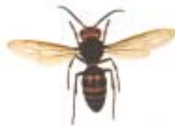
コダカスズメバチ